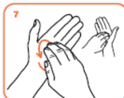
frizione rotazionale, in avanti ed indietro con le dita della mano destra strette tra loro nel palmo sinistro e viceversa