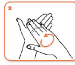
frizionare le mani palmo contro palmo