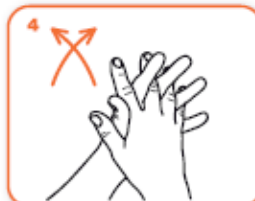
palmo contro palmo intrecciando le dita tra loro