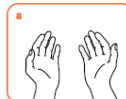
...una volta asciutte, le tue mani sono sicure.