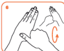
frizione rotazionale del pollice sinistro stretto nel palmo destro e viceversa