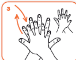
il palmo destro sopra il dorso sinistro intrecciando le dita tra loro e viceversa